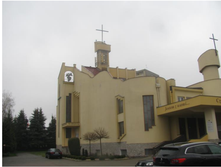
Zaf. nr 1: Widok ogólny instalacji radiokomunikacyjnej.